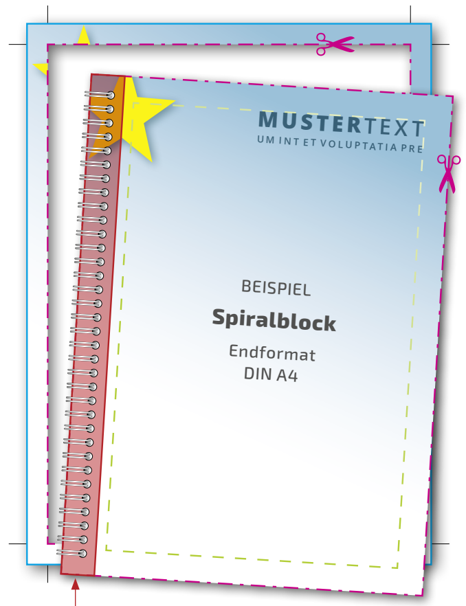
Texte und Objekte sollten nicht im Bereich der Spiralbindung positioniert werden. Wir empfehlen einen Sicherheitsabstand von 10 - 20 mm.

Verhindert unerwünschten Anschnitt Ihrer Texte und Informationen. Platzieren Sie Texte (hier Mustertext) und wichtige Objekte nur innerhalb dieses Rahmens. So können Sie sicher sein, dass die Informationen nicht angeschnitten werden.